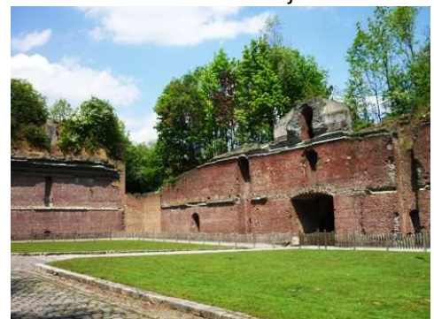
Le Fort de Bondues aujourd'hui