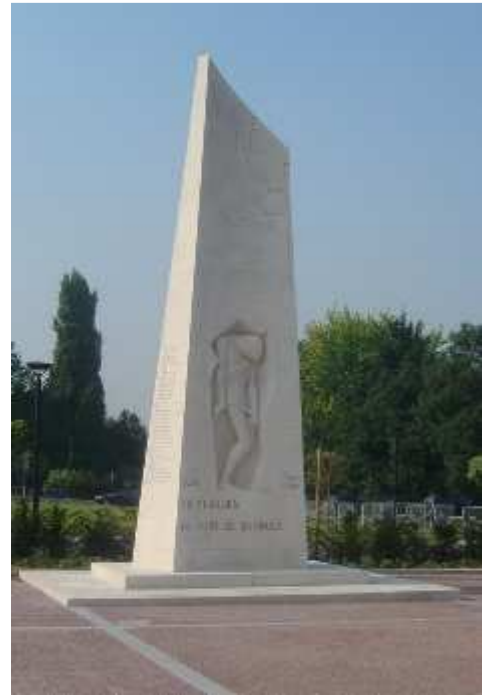
Le mémorial de 1965