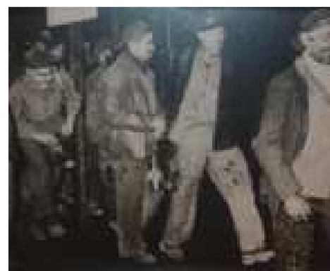
Mineurs du Nord-Pas-de-Calais