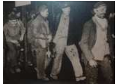
Mineurs du Nord-Pas-de-Calais

Etienne Dejonghe, « Chronique de la grève des mineurs du Nord-Pas-de-Calais, 27 mai-6 juin 1941 », Revue du Nord, n° 273, 1987.