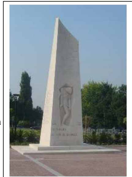
Le mémorial de 1965

5. Sur le plan ci-dessous, vous pouvez constater que les deux-tiers du fort ont été détruits en septembre 1944. Associez chaque lettre à un des noms suivants : Mémorial, Musée, Cour Sacrée.