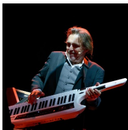
Spectacle Furioso Opus 3