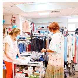
Vente exceptionnelle au vestiaire solidaire