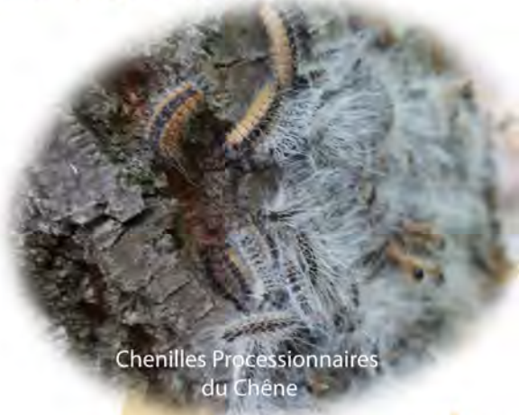
Chenilles Processionnaires du Chêne

Attention, il ne faut pas la confondre avec la processionnaire du pin ou le Bombyx cul-brun.