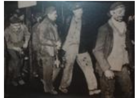
Mineurs du Nord-Pas-de-Calais

Etienne Dejonghe, « Chronique de la grève des mineurs du Nord-Pas-de-Calais, 27 mai-6 juin 1941 », Revue du Nord, n° 273, 1987.